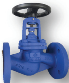
A VIA DIRITTA

VALVOLA A FLUSSO AVVIATO - TENUTA A BADERNA in GG 25 - FLANGIATA PN 16