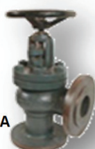
VIE A SQUADRA

Impiego : acqua-vapore-olio Corpo : ghisa GG25 (EN-GJL-250) Tenuta : a baderna grafitata sedi tenuta : acciaio inox Albero : AISI 321(X20 Cr13) Guarnizioni : Esente amianto Attacchi : flangiati UNI PN 16