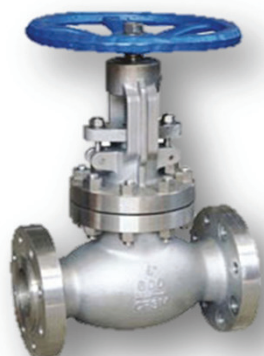
VALVOLA PN 100

VALVOLA A FLUSSO AVVIATO - TENUTA A BADERNA FLANGIATA PN 100